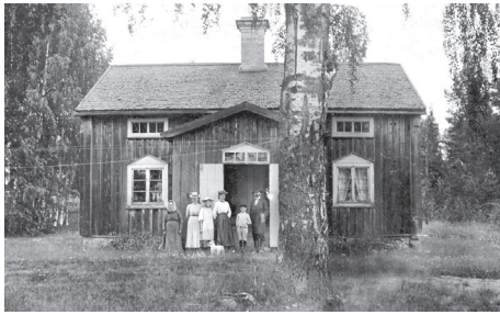
Annerfors Lärar- klockarbostad 1800-tal