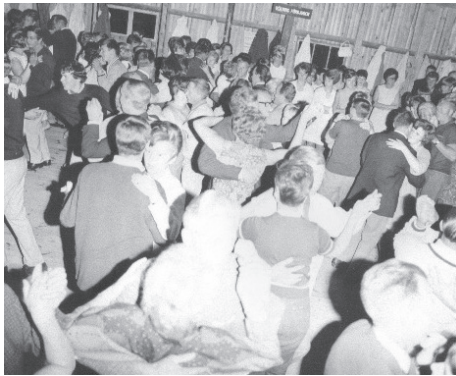
Trängseln är stor på Jönses loge

Kl 11-18 Jönnes Loge, (20) Herte: Du minns alldeles säkert månskenskvällarna på Jönnes - Finnskogens Nalen! Återupplev din ungdoms danskvällar, när nu Jönnes håller öppet hus. Minnesutställning på puben, fika i Cafe Ladgård och stort Loppis uppe på danslogen.