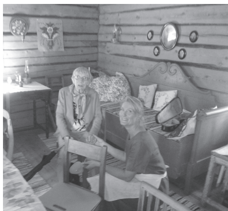
2 bojäntor i Sjulsbo

KI.11-16, Sjulsbovallen, (15) där bojäntorna kärnade smör, ystade ost, vallade boskap om sommarn, där hittar du idag gammeltidens hantverkare - o så finns här kaffe med dopp, korbv och du kan få en goan surströmming också för den delen. Förresten, ta med din fela eller dragspel eller mungiga eller vad du har, för här ska bli en trevlig dag!