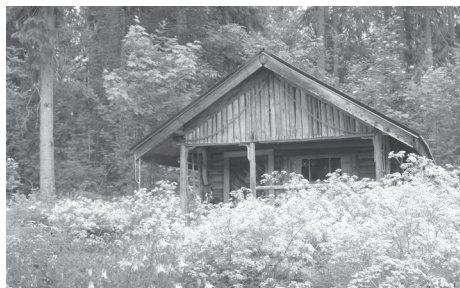
Olles Stuga inbäddad i grönska

KI 10-14, Gustavsfors: (10) Ett stilla lugn – väl mött i Olle Svenssons skrivarkoja – se text måndag.